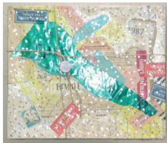
Pacco postale 1986

Esposizione: Sesto Calende, Galleria Cesare da Sesto" 1970