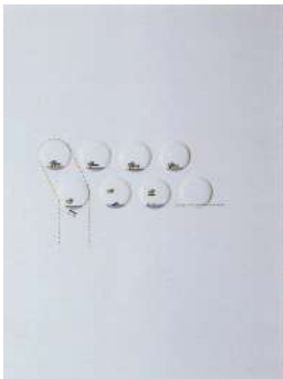
Riflessi 51 1967