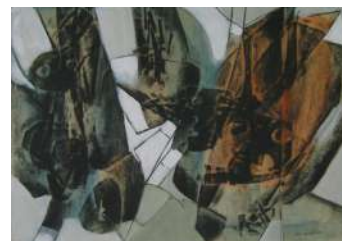
Conseguenze 1962 olio su carta riportato su tela, cm 50x70

Esposizioni: Rieti, Palazzo Potenziani Fondazione Varrone 2007; Teramo, Pinacoteca Civica 2009; Trieste, Scuderie del Castello di Miramare 2011.