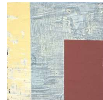
Painting 1997 acryl-vinil su legno, cm 19x19x5,5

Esposizione: Milano, Galleria Gian Ferrari 1968.