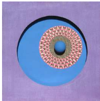
Composizione 1975 idropittura e collage su tela, cm 30x30

Esposizione: Sesto Calende, 2° Premio di pittura "Cesare da Sesto" 1962.