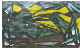
Montagne 1950 olio su tela, cm 50x80

Esposizioni: Milano, Palazzo dell'Arengario, 1977; Sesto Calende, Galleria Proloco, 1982; Bellano, Ex cotonificio Cantoni, 2004.