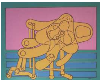
Macchina Inutile 1968

Esposizioni: Sesto Calende, Spazio "Cesare da Sesto" 2004; Siena, Palazzo Pubblico "Magazzini del Sale" 2006; Rivara, Castello di Rivara, 2006.