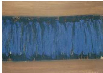
I fiori amano il cielo 1961 tempera e olio su carta riportato su tela, cm 50x73

Esposizione: Morazzone, Artisti Contemporanei 1968.