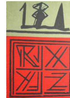
Segni 1968 olio su tela, cm 46x33

Esposizione: Milano, Galleria Caini 1992.