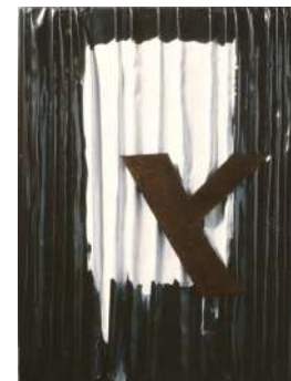
Lettera alfabeto Y 1992 piombo, cm 37x28

Esposizione: Sesto Calende, Galleria "Cesare da Sesto" 1976