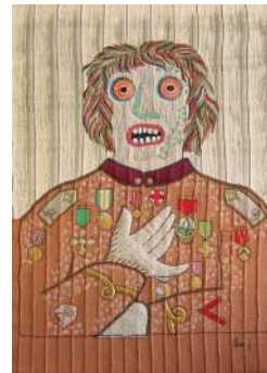
Generale 1980 progetto su telaio, cm 75x55

Esposizione: Milano, Galleria San Fedele 1980.