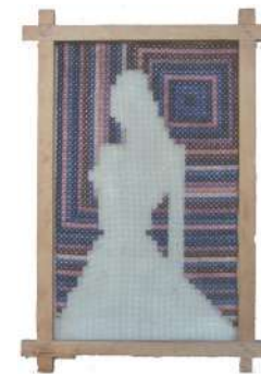
Figura 1975 ricamo su tela, cm 93x57

Esposizione: Bergamo, Dragoni ambienti d'oggi 1962.