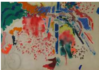
Personaggi 1942 olio su tela, cm 70x100

Antonella Paccini Assessore alla Cultura